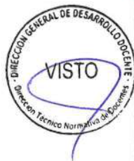
Ficha de evaluación para docentes de EBR, EBE y EBA